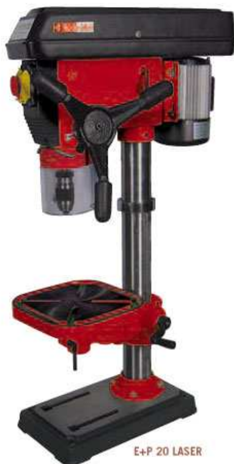
E+P 20 LASER