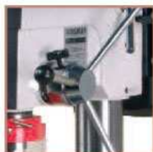
Tope de gran fiabilidad.