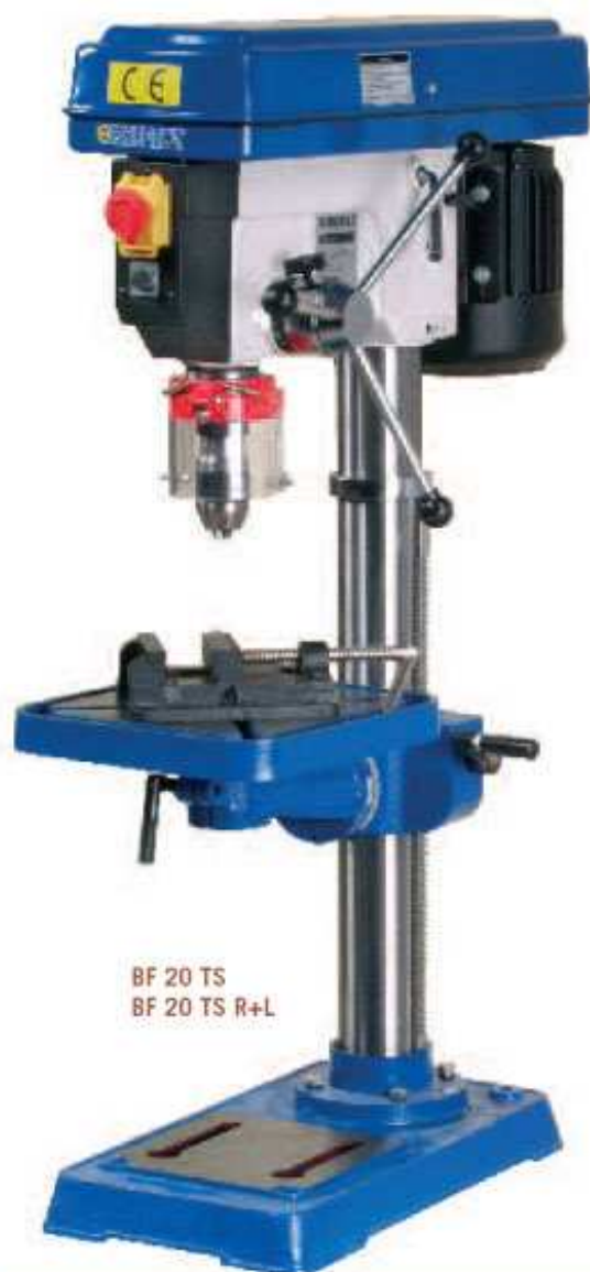
BF 20 TS BF 20 TS R+L