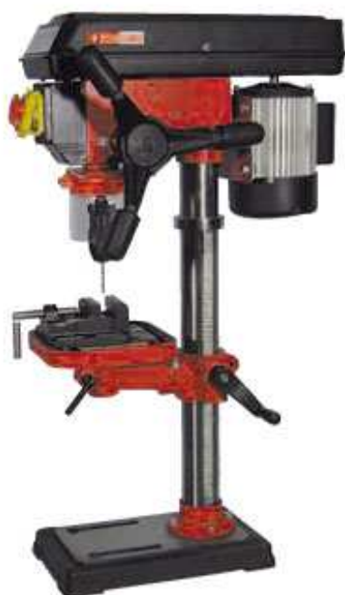
E+P 13 LASER