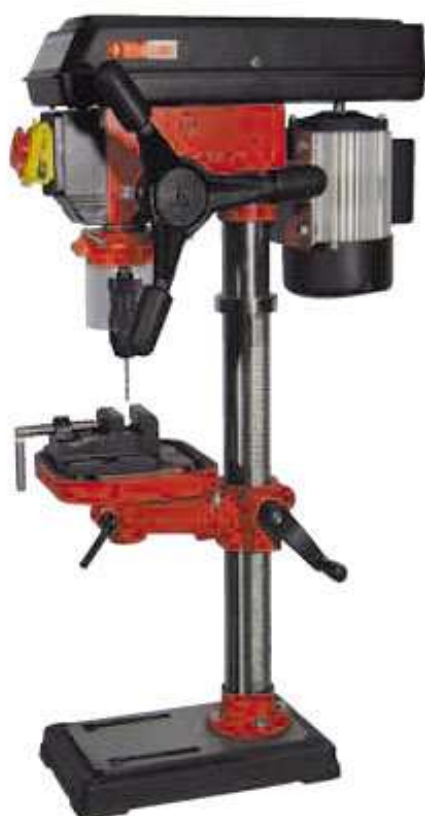
E+P 16 LASER