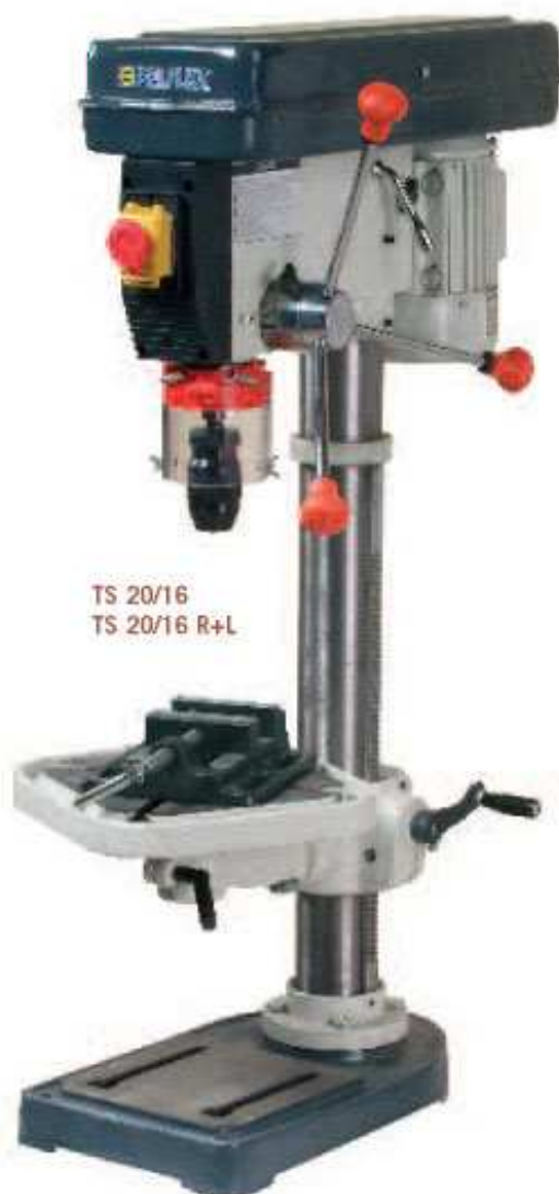
TS 20/16 TS 20/16 R+L