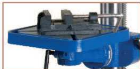
Robusta mesa ranurada para líquido refrigerante. Inclinable \pm 45^\circ .