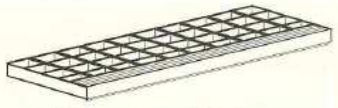
PELDAÑOS PARA SOLDAR Y APOYAR